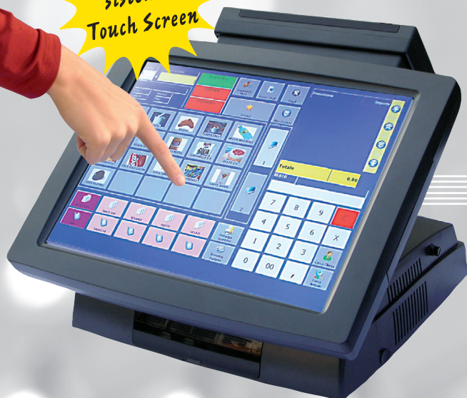
PC CON MONITOR TOUCH SCREEN