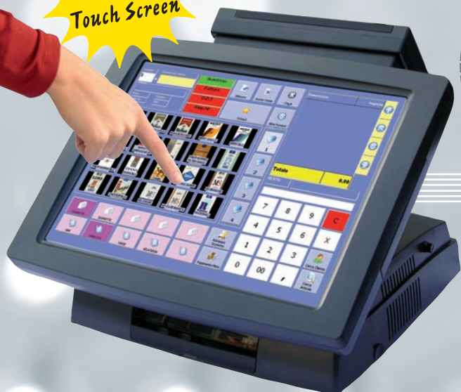
PC CON MONITOR TOUCH SCREEN