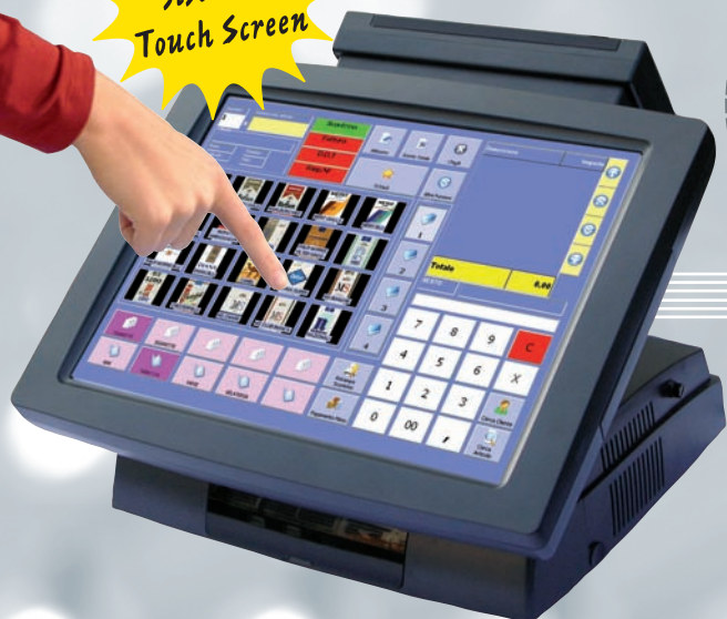
PC CON MONITOR TOUCH SCREEN